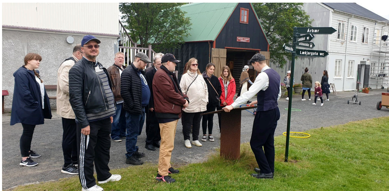
Ferðafélagið Víðsýn fór í dagsferð á Árbæjarsafn.

og spjall í gegnum síma ásamt einstaklingsmiðaðri þjónustu af ýmsum toga, með það að leiðarljósi að sinna félagslegri þörf og vera í samskiptum við gestina. Samkvæmt ummælum gesta var það sem mestu skipti á þessum tímum að tryggja starfsemi Vinjar þrátt fyrir takmarkanir. Ennfremur kom í ljós að nauðsynlegt var fyrir gesti Vinjar að geta komið í Vin til að slá á kvíða sem getur versnað mikið á umbrotatímum og ótta um afdrif félaga sinna í Vin.