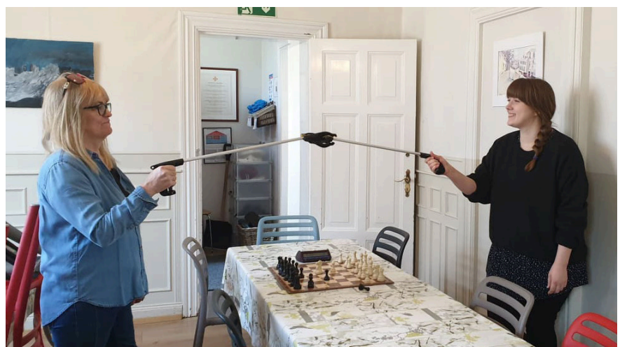
Brugðið á leik í Vin, heilsa með sóttvarnir í huga.