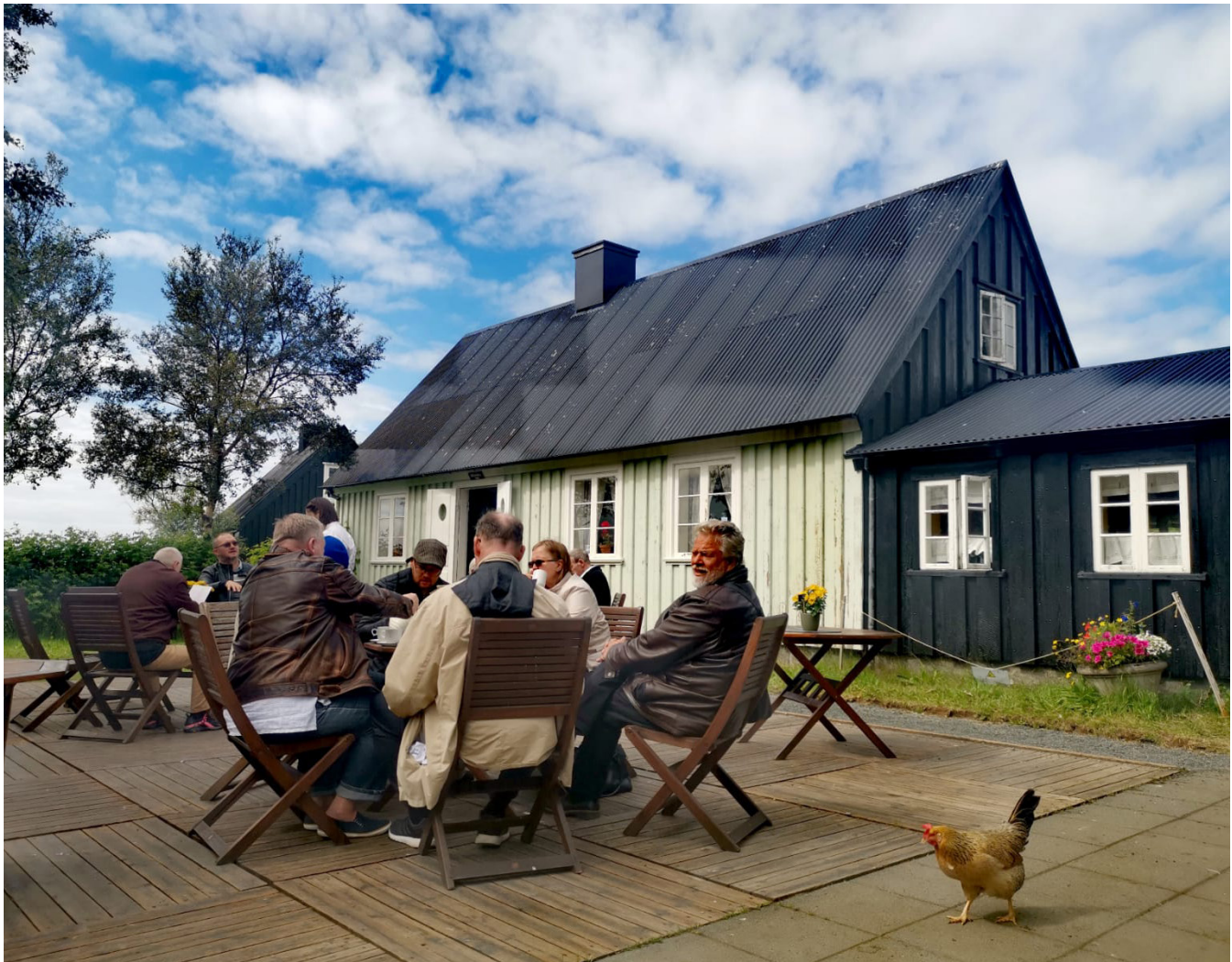
Kaffisopi og spjall á Árbæjarsafni.

Vin er dagsetur fyrir fólk með geðraskanir. Eitt helsta hlutverk Vinjar er að draga úr einangrun og byggja upp félagslegt umhverfi. Lögð er áhersla á fræðslu- og batamiðuð verkefni til að efla virkni og mæta þörfum þeirra einstaklinga sem sækja Vin með tilliti til þarfa og áhuga hvers og eins. Mikil áhersla er á einstaklingsmiðaða nálgun og felst stór hluti starfseminnar í aðstoð og stuðningi til að sinna ýmsum þáttum daglegs lífs sem getur verið mikil áskorun fyrir fólk með geðfötlun.