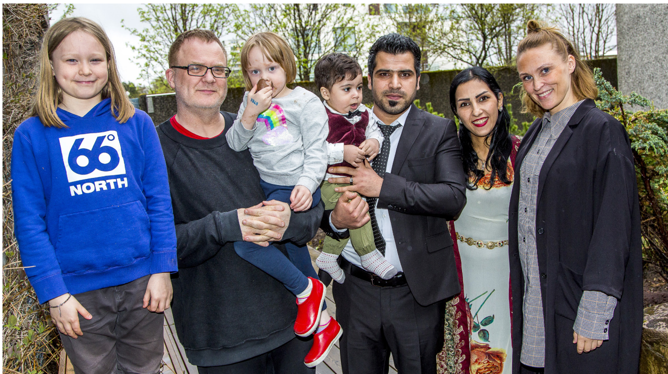
Fjölskyldur tengjast vinaböndum í gegnum verkefnið Leiðsöguvinir.

Í verkefninu Leiðsöguvinir eru einstaklingar eða fjölskyldur með alþjóðlega vernd paraðir við íslenska sjálfböðaliða. Leiðsöguvinir geta svarað spurningum um lífið á Íslandi, talað um íslenska menningu og hefðir, orðið vinir þeirra nýkomnu og hjálpað þeim að finna sinn stað á Íslandi. Með verkefninu verða til brýr á milli fólks með ólíkan bakgrunn og Leiðsöguvinir vísa veginn inn í íslenskt samfélag.