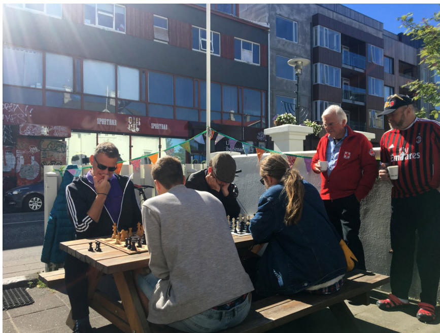
Skákfélag Vinjar nýtir góða veðrið til að tefla úti.

Árið 2020 var mikil áskorun fyrir starfsemi og rekstur Vinjar. Sú valdefling sem unnið var eftir varð nokkuð flókin í framkvæmd þar sem takmarka þurfti samgang. Allar breytingar eru mikil áskorun en lykilatriðið var að halda rammanum í starfseminni og halda í þann góða og hlýja anda sem einkennir