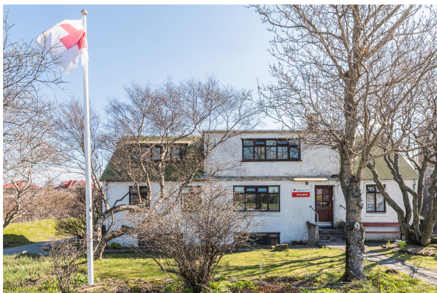
Konukot við Eskihlíð 4.

Rauði krossinn í Reykjavík hefur annast rekstur Konukots, neyðarskýlis fyrir heimilislausar konur í Eskihlíð í Reykjavík, frá 10. desember 2004. Forsaga athvarfsins er sú að gerðar voru þarfagreiningar og rannsóknir sem leiddu í ljós að fjöldi heimilislausra kvenna væri á vengangi í Reykjavík. Taldi stjórn Rauða krossins í Reykjavík mikilvægt að opna athvarf hið fyrsta og gekk það eftir.