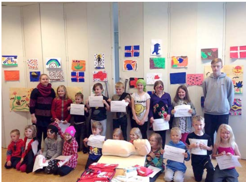
Á námskeiðunum læra börn um starf Rauða krossins, fá kennslu í skyndihjálp og starfa með eldri borgurum.