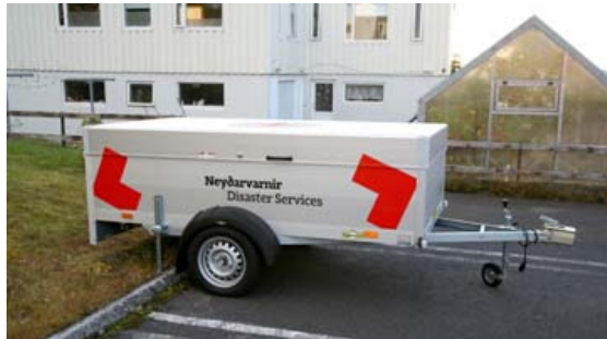
Neyðarvarnarhópurinn á Kerru en í henni eru dýnur, teppi og annar nauðsynlegur búnaður. Kerran var lánuð á Suðurlandið þegar gaus í Eyjafjallajökli.

neyðarvarnarhópurinn var ræstur út var byrjað að undirbúa komu slasaðra í húsnæði skólans. Veðrið var svo vont að ekki var stætt úti. Þeir sem ekki fóru beint á sjúkrahús voru skodaðir í fjöldahjálparmiðstöðinni. Hlúð var að börnunum sem voru að vonum skelkuð eftir þessa lífsreynslu."