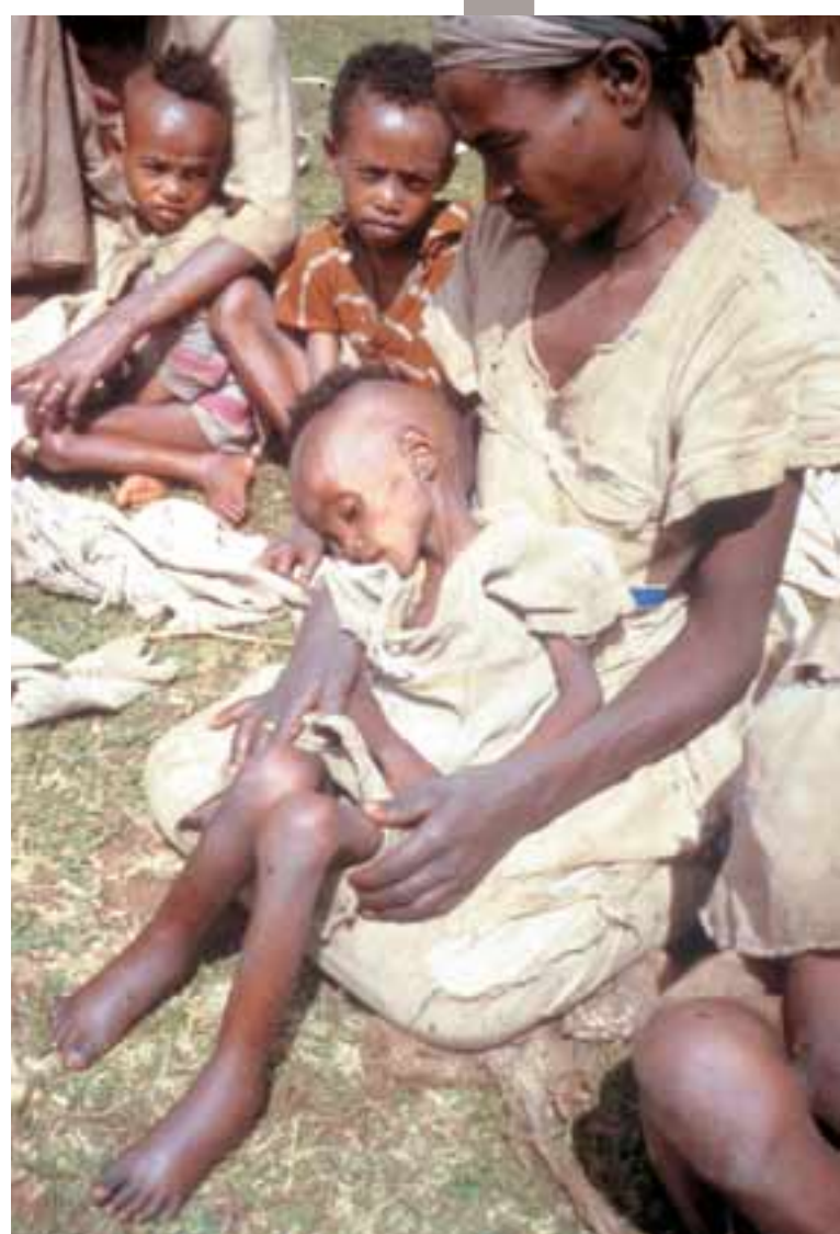
Talið er að mikill fjöldi manna fari á vergang þegar hungrið sverfur að.

Rauði kross Íslands hefur með aðstoð nokkurra fyrirtækja safnað fé til hjálparstarfsins. Skeljungur gaf þrjár krónur af hverjum seldum lítra af eldsneyti eina helgi, Lyfja 100 krónur af hverjum seldum lyfseðli í