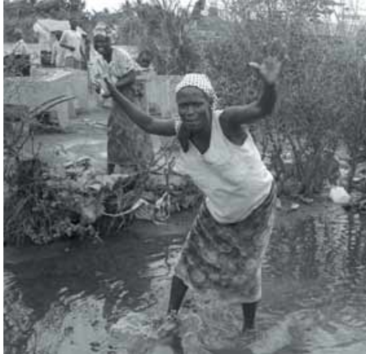
Féð sem safnaðist í söfnun Rásar 2 rennur m.a. til hreinsunar vatns í Mósambík en vatn mengaðist mjög í flóðunum þar fyrir á árinu.

traustur. Það má þó ekki hafa safnanir of oft, þá verður fólk bara leitt á þeim.“