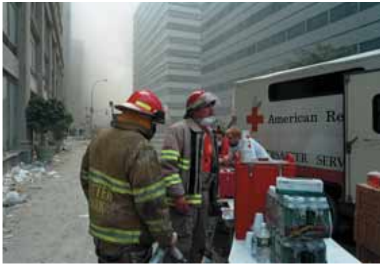
Björgunarmenn fá að svala þorsta sínum hjá Bandaríska Rauða krossinum. Um 20.000 manns starfa nú fyrir hreyfinguna við neyðaraðstoð og alls hafa menn reitt fram 1,6 milljónir máltíða til eftirlifenda og björgunarmanna.

Um 20 þúsund manns starfa nú fyrir bandaríska Rauða krossinn við neyðaraðstoð. Hreyfingin hefur skotið skjólshúsi yfir á fimmta þúsund manna í 76 skýlum og reitt fram 1,6 milljónir máltíða til eftirlifenda og björgunarmanna. Þá hefur hreyfingin komið upp þremur vörugymslum og birgt þær upp af matvælum, hreinlætisvörum, rafhlöðum og öðrum nauðsynjum. Bandaríski Rauði krossinn hefur einnig tekið að sér það hlutverk að hafa umsjón með því að blóðbankar landsins fái nægilegt blóð fyrir alla sjúklinga sem þess þurfa.