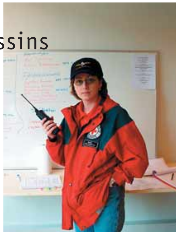
Rauði krossinn tekur þátt í fjölmörgum neyðarvarnaæfingum árlega. Á döfinni eru rútu- og flugslysaæfingar og einnig er að hefjast undirbúningur fyrir Samvörð 2002 þar sem æfður verður flutningur fólks frá Eyjum til lands.

Endurskoðunin nú felst meðal annars í því að setja upp SMS-útkallskerfi fyrir neyðarnefndir deildanna til að stytta viðbragðstímann. Auk þess er nú reynt að samræma aðgerðir manna og skilgreina betur hver hefur hvaða hlutverk. „Þessi tíðu rútuslys minna okkur á að hópslysin geta orðið alls staðar.“