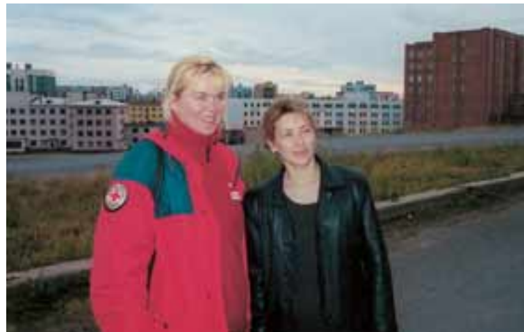
Sigrún ásamt formanni Rauða kross deildarinnar í Tajmyr-héraði. „Deildin er aðeins tveggja ára gömul en mjög öflug og með drífandi fólk í forystu.“ Í baksýn eru sovétblokkirnar í Dúdínka.

Að undanförunu hefur Rauði kross Íslands styrkt nokkur önnur verkefni í Rússlandi, m.a. berklavarnaverkefni í Pétursborg og nágrenni, og á þessu ári var orðið við neyðarbeiðni vegna flóða austar í Síberíu. Utanríkisráðuneytið varði tveimur milljónum í framleiðslu á teppum sem nýlega hefur verið dreift þar en Rauði kross Íslands keypti eldhúshöld, skólatöskur og skólavörur fyrir 3 milljónir. Þetta fór til fjölskyldna sem urðu illa úti í flóðunum.