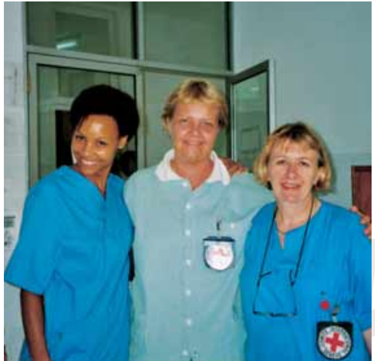
Pálína á milli tveggja samstarfsvenna, önnur er frá Sviss en hin frá Bretlandi.

andi nýlenda Portúgala og hjálenda Indónesa hafði hlotið sjálfstæði. „Það er svo sem ekki skrítið. Þarna voru um átta þúsund starfsmenn SP og friðargæsluliðar á góðum launum. Það er gríðarlegt atvinnuleysi þarna og fullt af ungum, hraustum en ómenntuðum karlmönnum fullum af hormónum og ef þeir komust yfir áfengi var ekki von á góðu. Reiði þeirra er alveg réttmæt en þeir verða líka að gera sér grein fyrir að þjóðin getur ekki risið upp hjálpar- laust. Við hjá Rauða krossinum fund- um hins vegar lítið annað en þakk- læti frá fólki, enda Alþjóðaráðið vel þekkt á Austur-Tímor eftir 25 ára starf þar.“