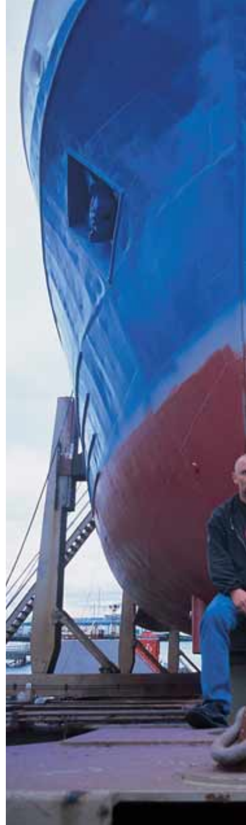
„Ég hef nú sem betur fer aldrei sofið beinlínis úti undir berum um. Stundum í bátum í slíppnum en þá er maður í verulegri líflandi, í misjöfnu ástandi, það er ekkert grín. Þar kemur reynsla

Sautján ára piltur sem leitaði til Rauðakrosshússins fyrr á þessu ári. Forráðamaður hans, félagsráðgjafi og starfsmenn Rauðakrosshússins eru sammála um að hegðun hans sé ekki eðlileg. Hegðunarvandamál hans hafa hins vegar ekki viðurkenndan stimpil í kerfinu. Pilturinn dvaldist nokkrar vikur í Rauðakrosshúsinu en hvarf síðan einn daginn. Þrátt fyrir langa dvöl í húsinu fannst engin viðunandi lausn innan Félagsþjónustunnar á vanda þessa drengs. Hann lenti milli stafs og hurðar.