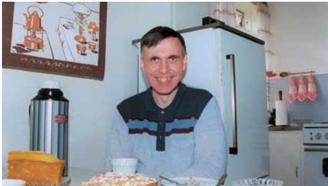
„Ferðafélagið Víðsýn er eini möguleiki minn til að ferðast. Ég á enga ættingja sem ég get ferðast með og ég treysti mér ekki til að kaupa mér ferðir vegna þess að fyrsta spurningin sem maður fær frá sessunautnum er: Hvað starfar þú?“