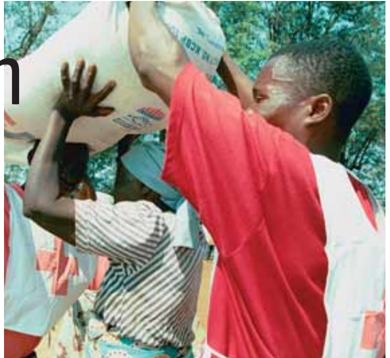
Kona setur 50 kílógramma þungan máisekk á höfuð sér í dreifingarstöð Rauða krossins í Malaví.

Löng röð af M6 flutningabifreiðum færast hægt eftir mjórrí slóðinni langt inni í afskekkustu héruðum Sambíu. Grænar hæðirnar sem einkenna landslagið í sunnanverðri Afríku mynda fagra umgjörð um hvíta trukkana. Það má greina vélargnýnn úr órafjarlægð þegar þessar sexhjóladrifnu flutningabifreiðar ösla gegnum þungfæra leðjuna. Þær fara ekki hratt yfir, en seiglast þó áfram af ótrúlegu öryggi með þungan farm sinn, eftir vegum sem enginn treystir sér til að aka venjulegum vörubifreiðum. Úr fjarska má greina merki Alþjóðasambands Rauða krossins og Rauða hálfmánans á vélarhlífum og hliðum trukkanna, stóran rauðan kross og rauðan hálfmána.