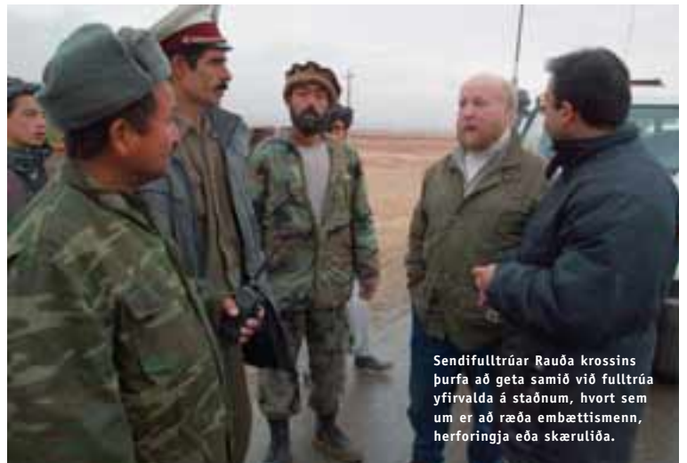
Sendifulltrúar Rauða krossins þurfa að geta samið við fulltrúa yfirvalda á staðnum, hvort sem um er að ræða embættismenn, herforingja eða skæruliða.

Vetrarkuldar hafa gert byggingaverkamönnum erfitt fyrir en allt kapp er lagt á að klára byggingarnar fyrir maí á þessu ári. Á meðan læra börnin í tjöldum sem reist hafa verið í þorpunum. Menntun barnanna verður ekki frestað þótt aðstæður séu erfiðar.