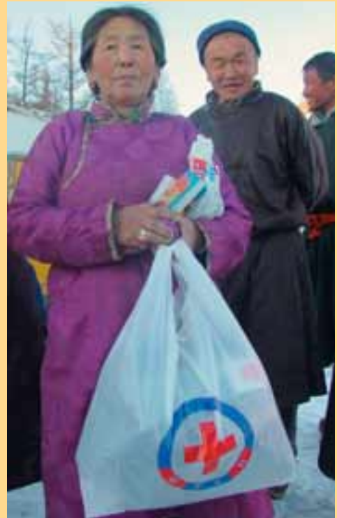
Oft er erfitt að þiggja hjálp en þúsundir manna í Mongólíu hafa engar aðrar bjargar.

Þær 2500 krónur sem hver styrktarfélagi greiðir á þessu ári duga til að veita einni manneskju, sem nú líður mikinn skort, nauðsynlega vetraraðstoð. Það munar því um hvert einasta framlag.