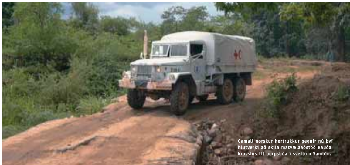
Gamall norskur hertrúkkur gegnir nú því hlutverki að skila matvælaaðstoð Rauða krossins til þorpsbúa í sveitum Sambíu.